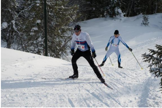
Se flere på dmlangrend.dk